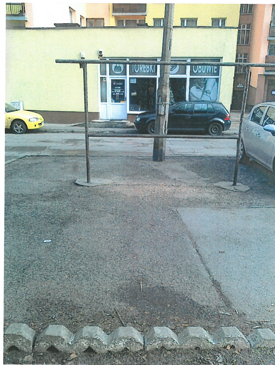
Widok na stronę bloku nr 34-klatka nr 8