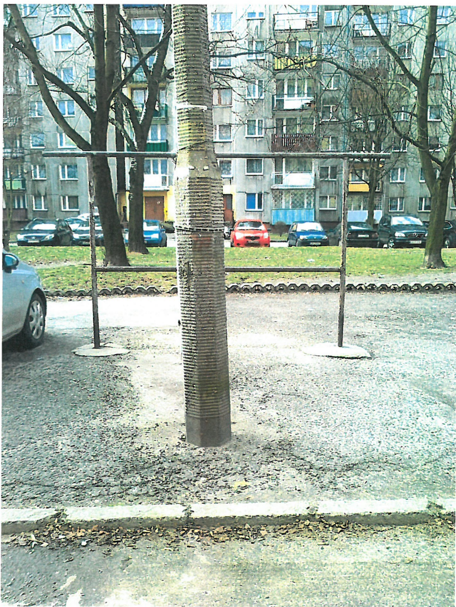
Widok w kierunku bloku nr 32-ul. Piłsudskiego. Proponowany kierunek przesunięcia słupa.

Zdjęcia tego samego słupa oświetleniowego, proponowanego do zmiany jego lokalizacji.