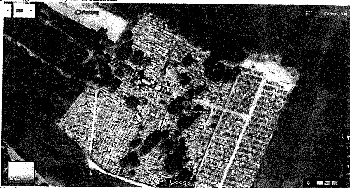
X- słup oświetleniowy

Cmentarz Parafialny Kościoła p.w. Św. Antoniego na Górze Gołonoskiej jest jednym z najczęściej odwiedzanych nekropoli w Dąbrowie Górniczej. Powstał około 1879 r. i jest miejscem pochówku wielu mieszkańców Dąbrowy Górniczej. W związku z powyższym wnioskuje o kompleksowe oświetlenie cmentarza. Już wczesnym wieczorem na terenie nekropolii jest bardzo ciemno, nie ma ani jednego punktu świetlnego w pobliżu. Proponuje instalację 4 słupów oświetleniowych, tak aby ułatwić wiernym korzystanie z cmentarza w celu uczczenia bliskich. Lokalizację zamieszczam na poniższym zdjęciu, na którym zaznaczam propozycję, gdzie można oświetlić drogę w głównym ciągu i bocznych drózkach.