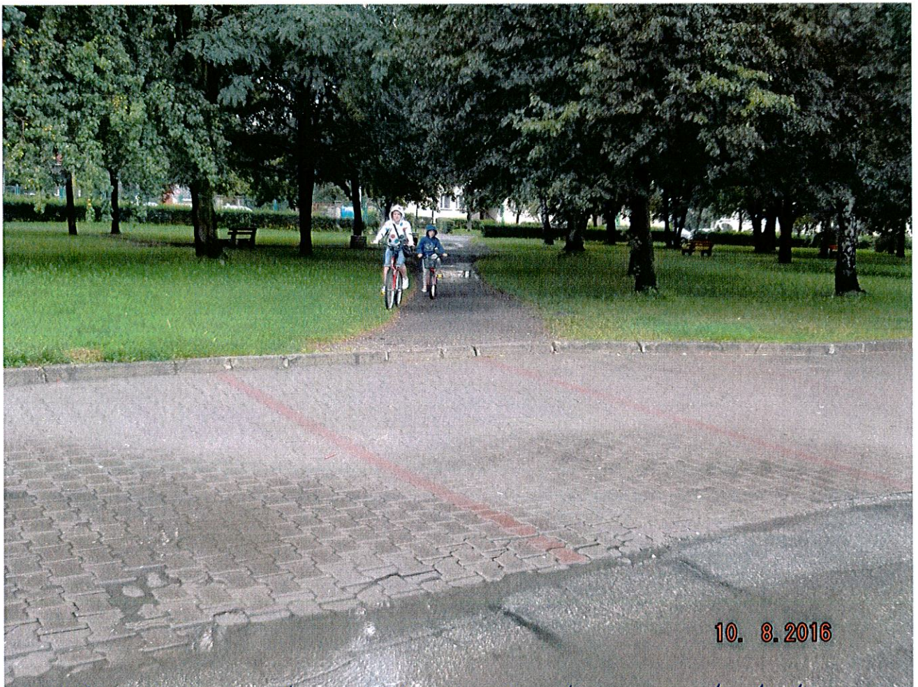
Widok od strony targowiska na ścieżkę przy plantach (widoczne samochodowe miejsca postojowe, będące kontynuacją ścieżki)