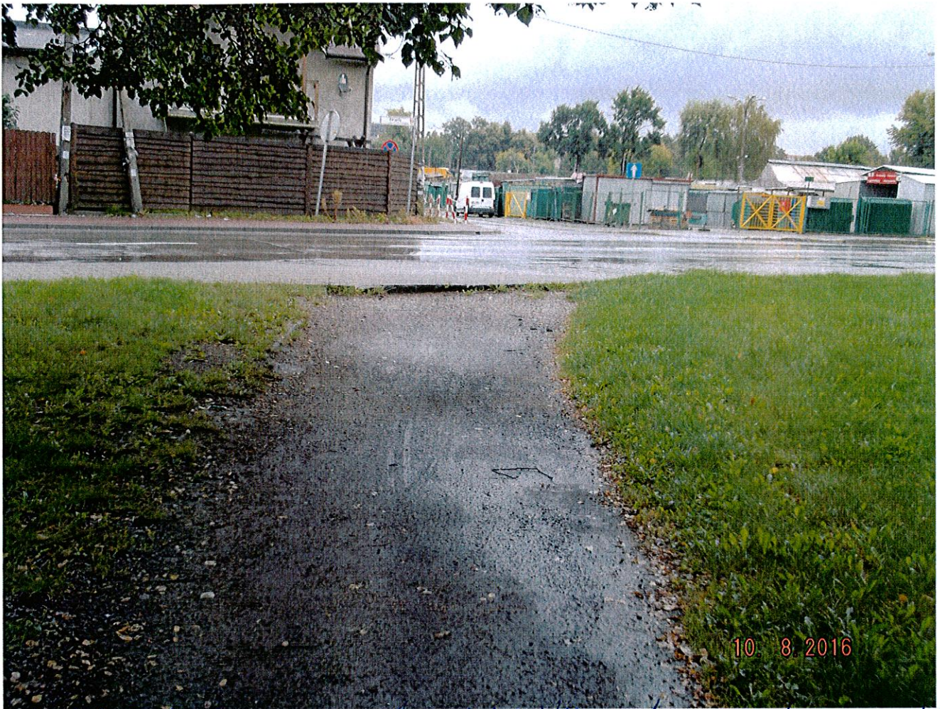
Widok od strony gruntowej ścieżki na targowisko miejskie.