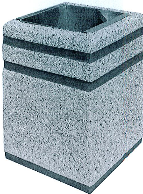
Rys. Wzór kosza betonowego