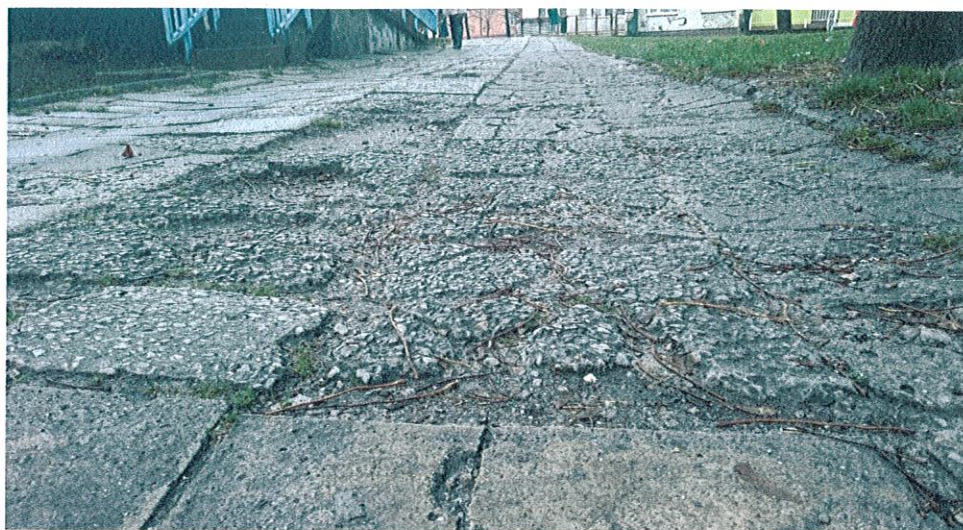
Zdjęcia obrazujące uszkodzenia nawierzchni chodnika: