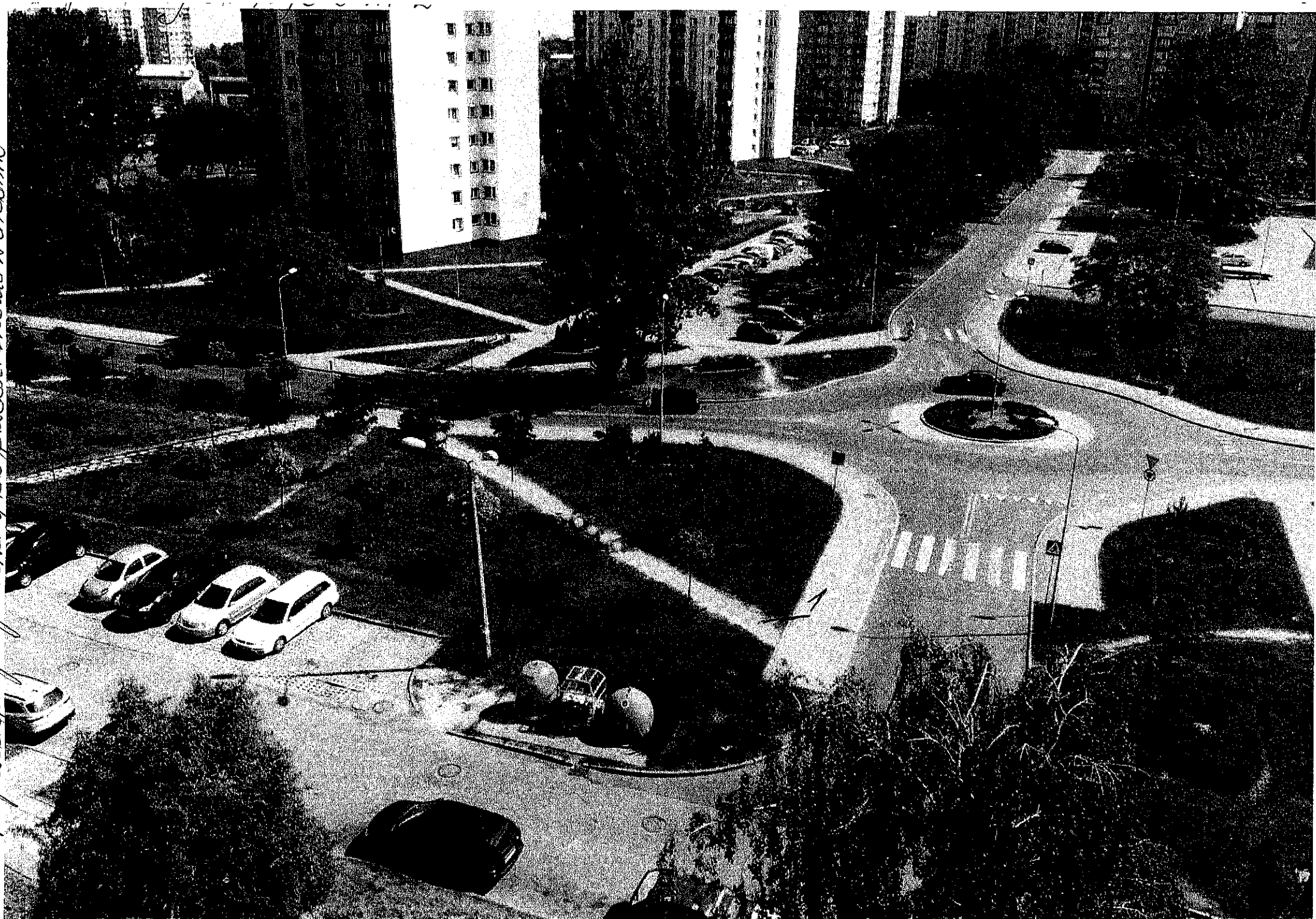
1 - проект пропозитиву до проекту Кенд и Чодник