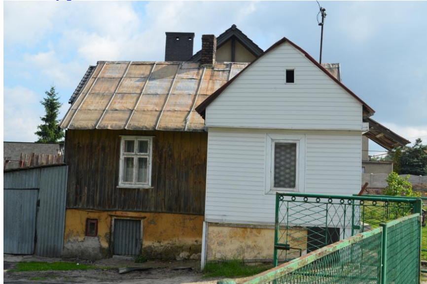
Widok północno - zachodni

4. Adres (ulica, nr posesji) obręb Okradzionów ul. Turystyczna 9 działka nr 35 k.m. 1