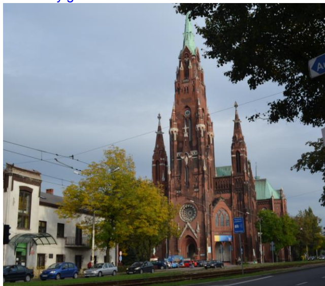
widok północno - zachodni