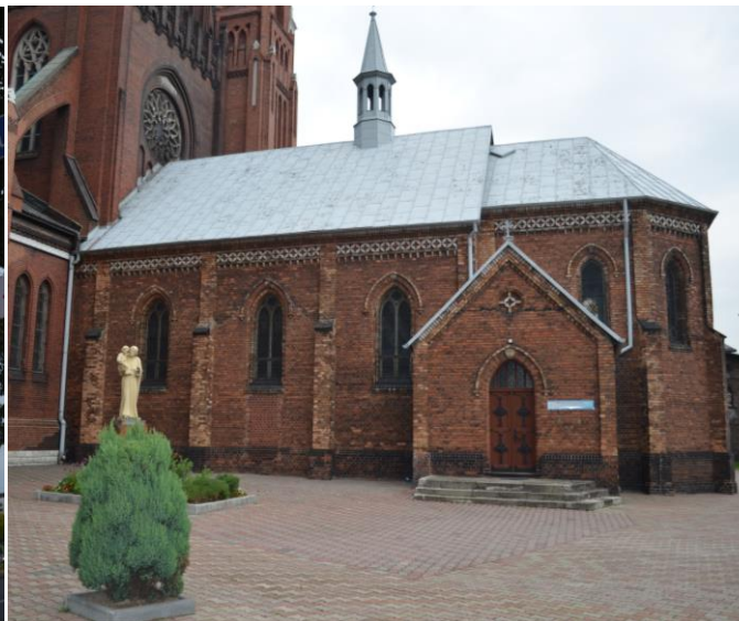
widok północno - wschodni