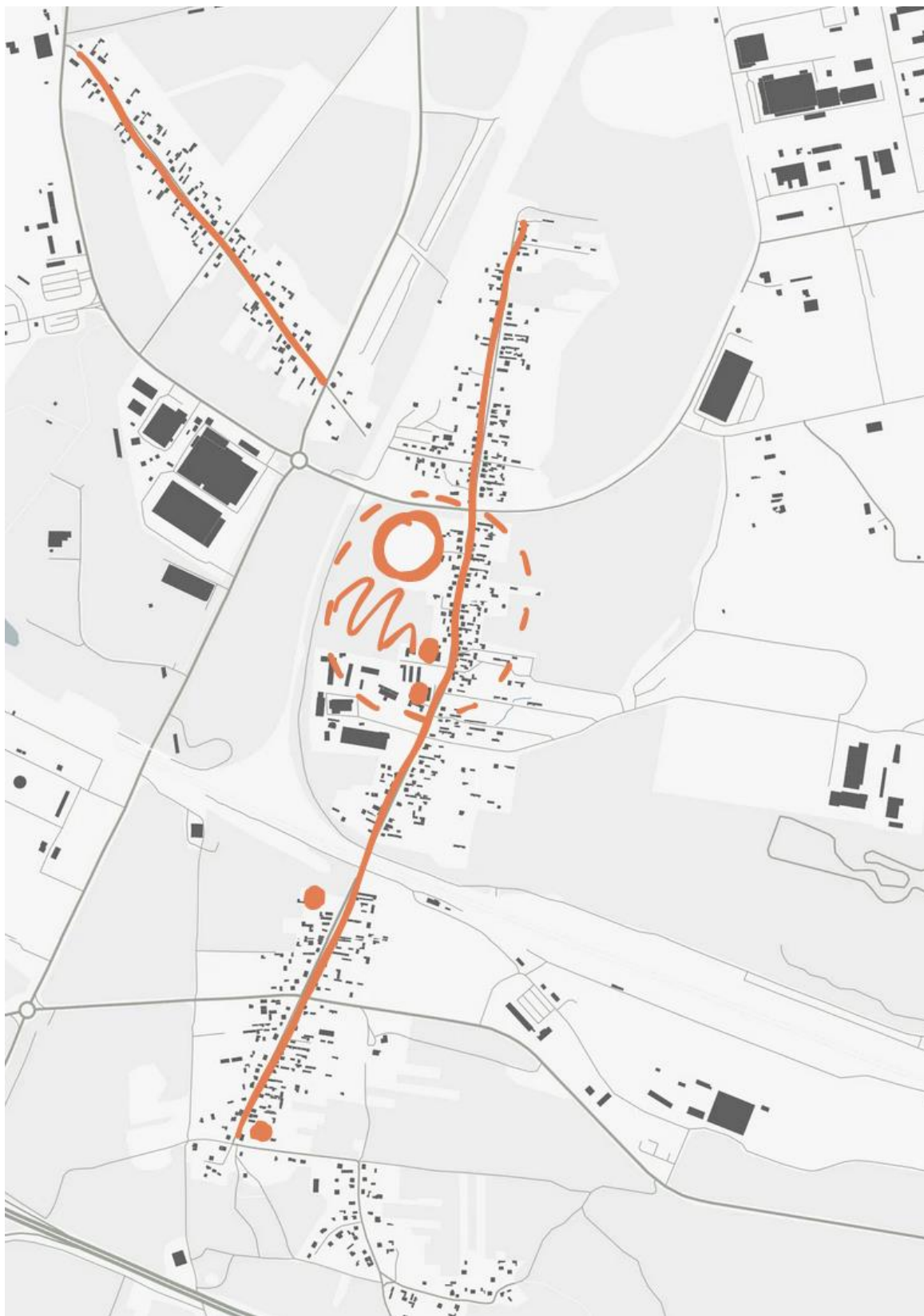
Rys 3 Opracowanie własne.

Dzielnica posiada charakter niemal ulicówki, zabudowa zlokalizowana jest wzdłuż głównej drogi ul. Głównej oraz dodatkowo wzdłuż ul. Każdębie, która niejako jest odizolowana