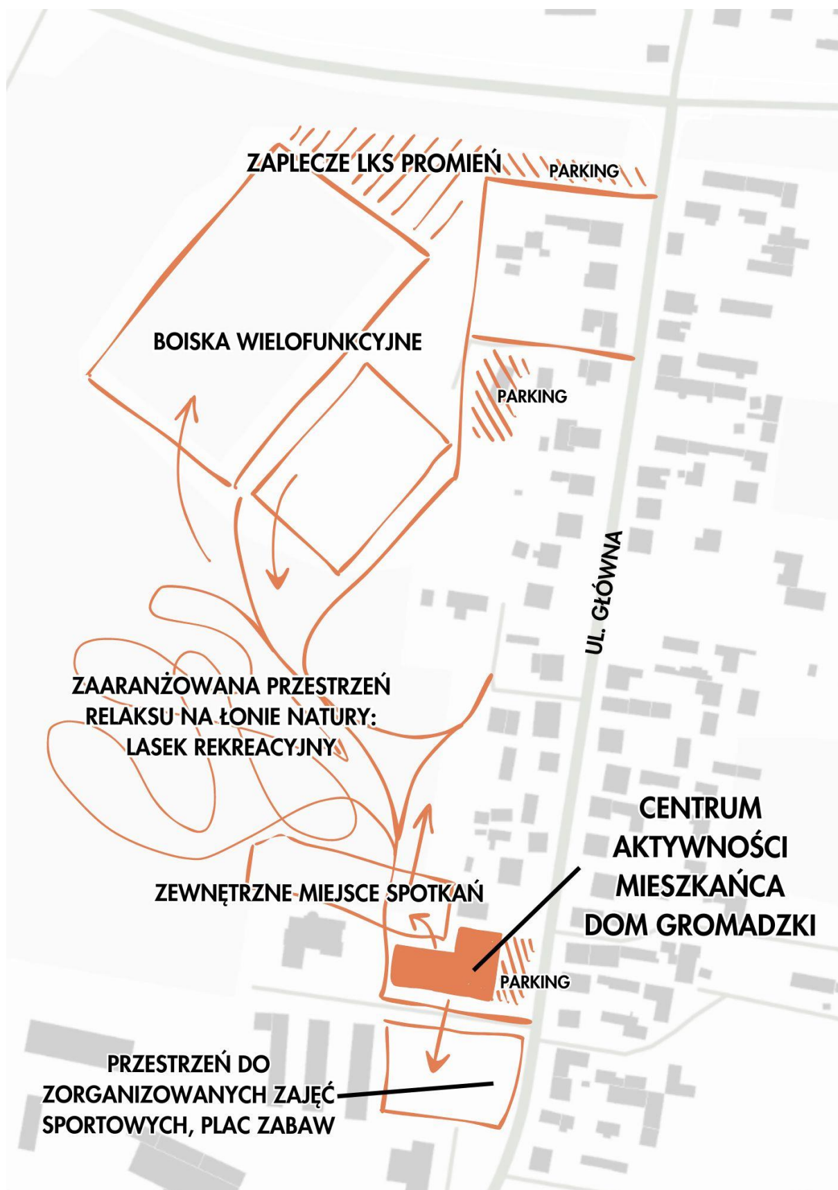
Rys 6 Opracowanie własne.