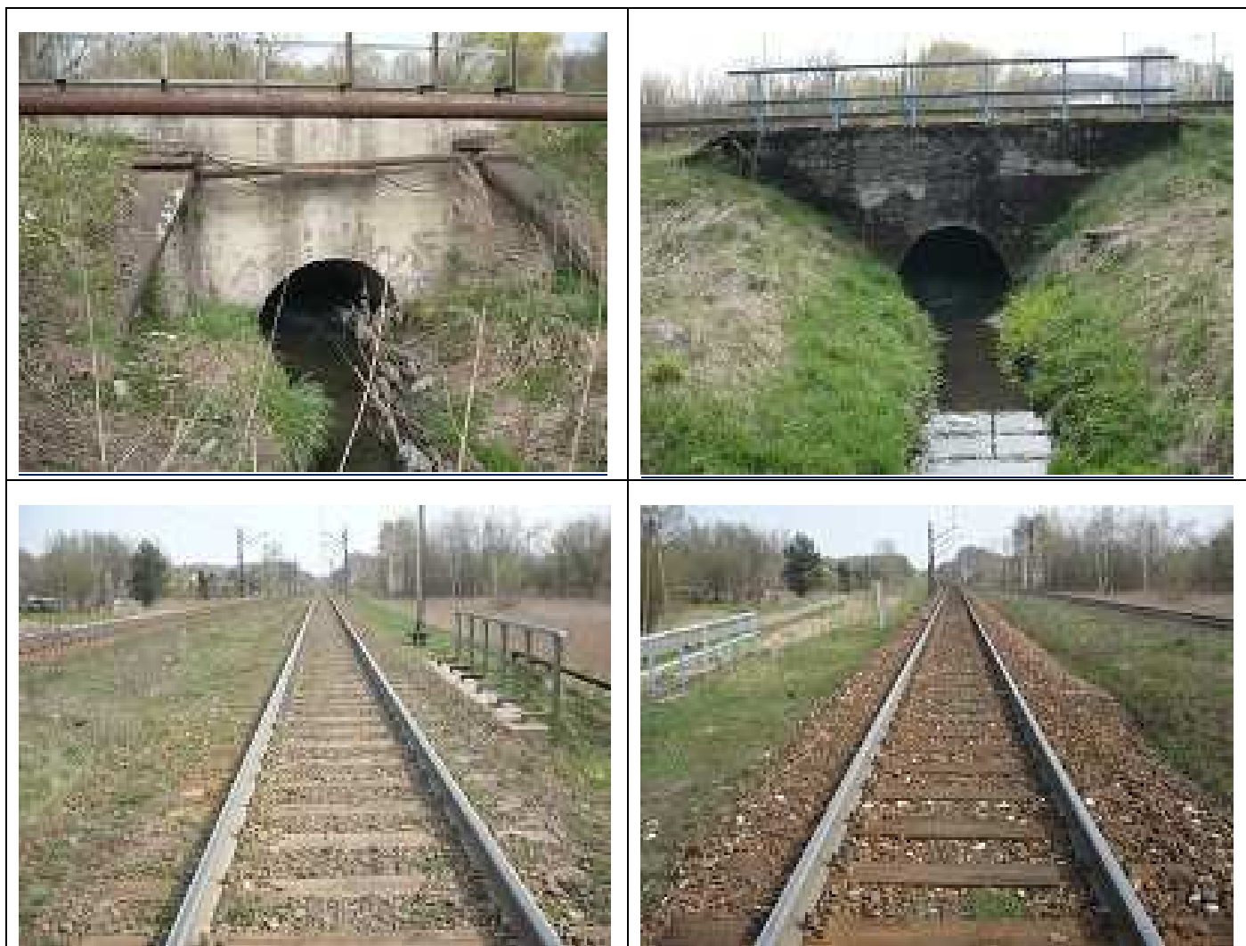
DOKUMENTACJA FOTOGRAFICZNA OBIEKTU