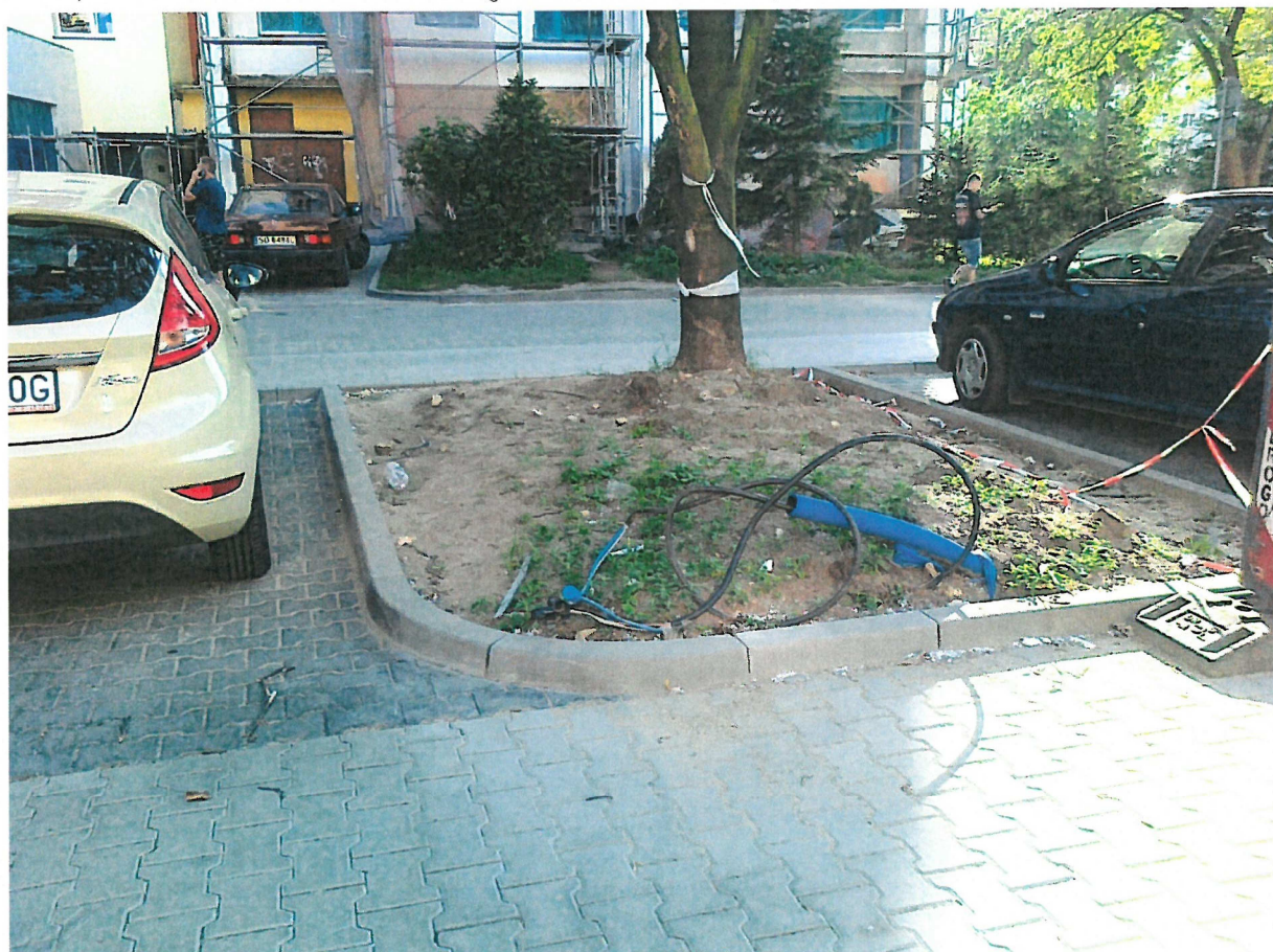
Dostęp na chodnik od strony parkingu.