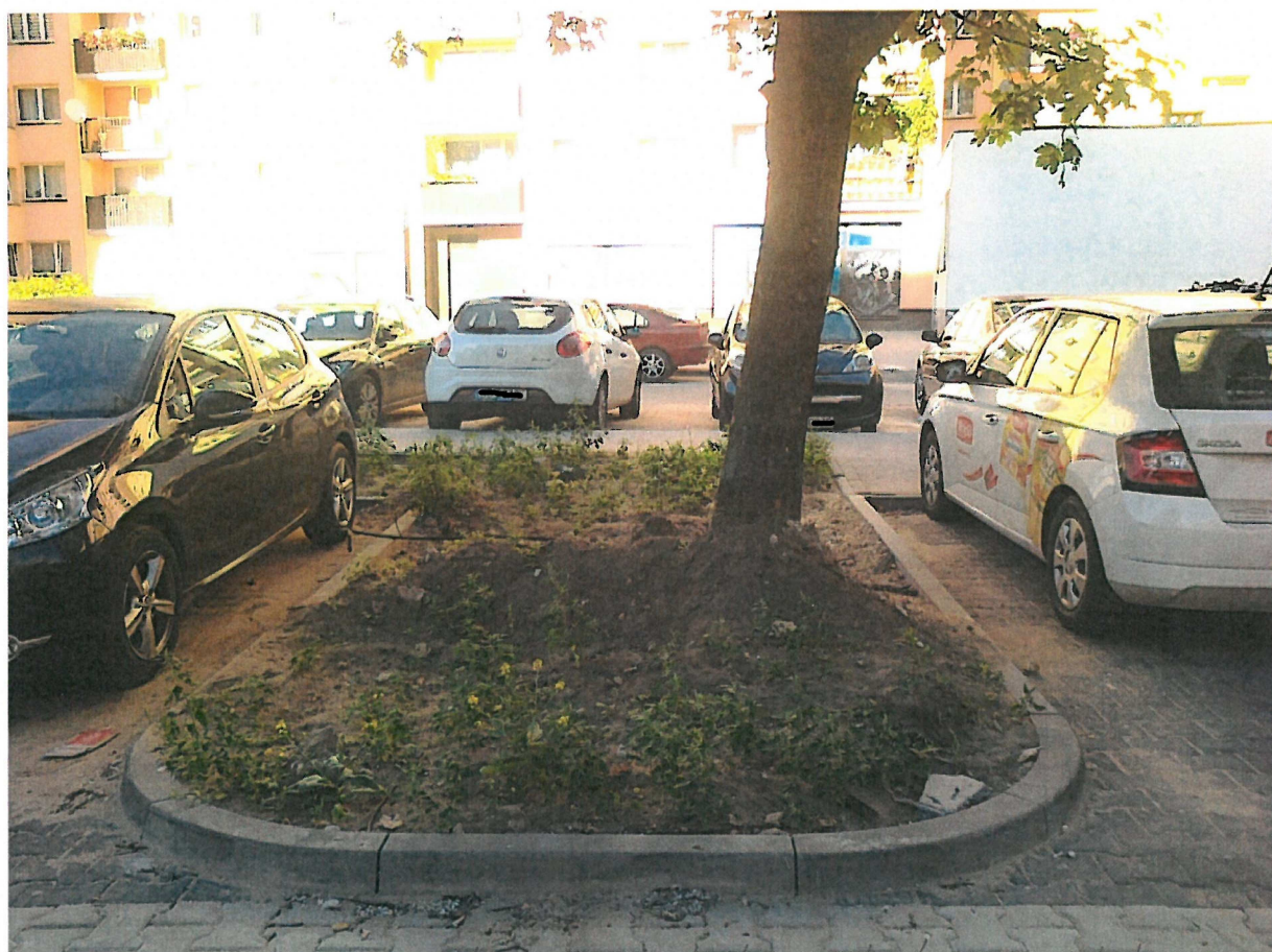
Dojście z parkingu w stronę chodnika od strony bloku nr 34