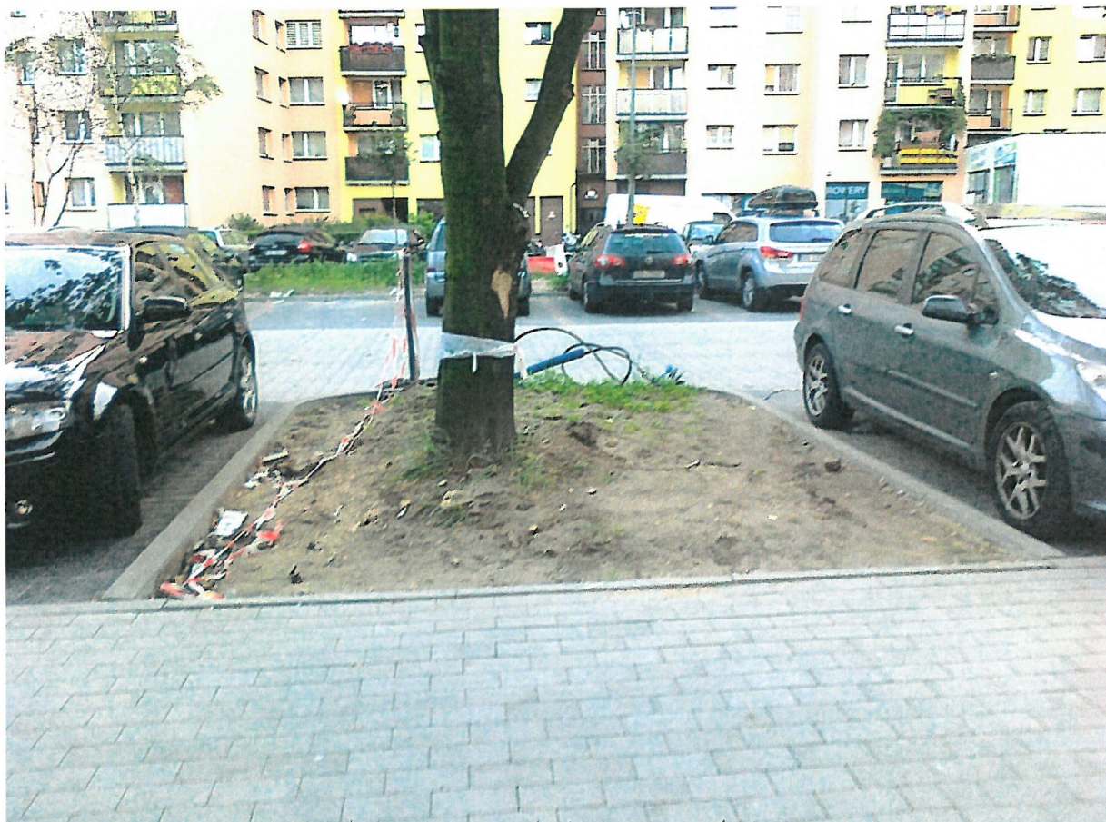
Dostęp do parkingu od strony chodnika przy bloku nr 32 (proponowane do częściowego utwardzenia)