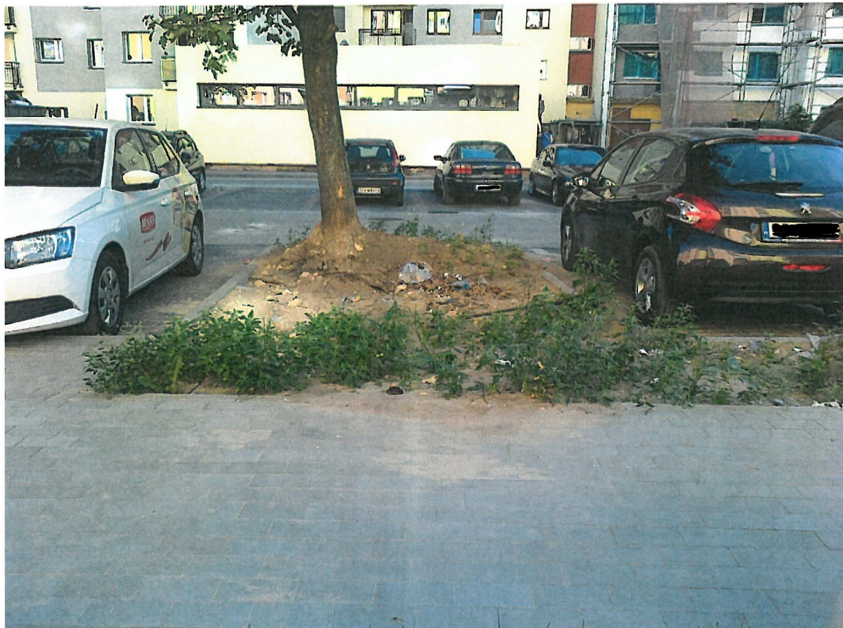
Dojście do parkingu od strony chodnika przy bloku nr 34