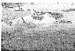
r1.jpg 95 KB