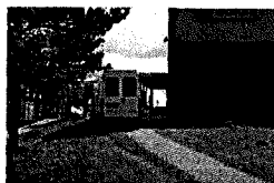
DSC_4792.JPG 5 MB