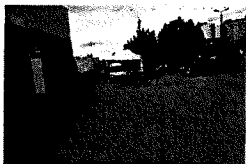
DSC_4794.JPG 9 MB