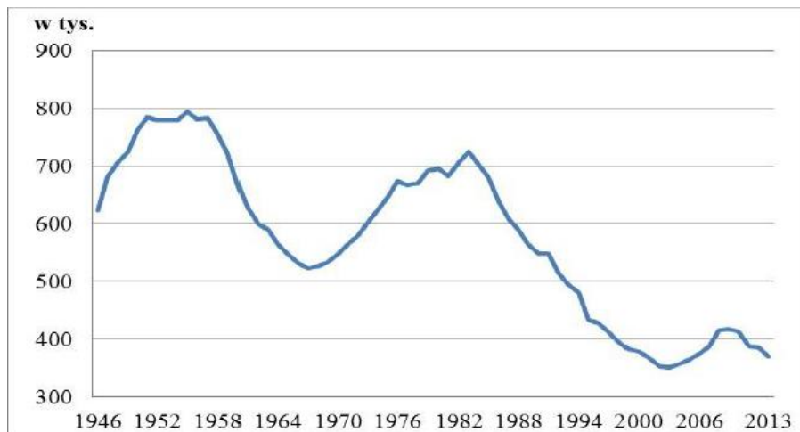
Rys.1. Wyższe i niższe demograficzne w Polsce po roku 1945

Dąbrowa Górnicza jest gminą starzejącą się – zmniejsza się liczba ludności, a jednocześnie wzrasta ilość osób w wieku poprodukcyjnym. W wiek senioralny weszły i nadal wchodzi osoby urodzone w latach 50-tych, kiedy notowany był największy przyrost liczby ludności.