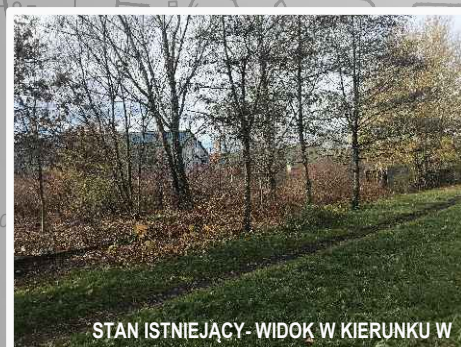
STAN ISTNIEJĄCY- WIDOK W KIERUNKU W