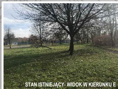
STAN ISTNIEJĄCY- WIDOK W KIERUNKU E