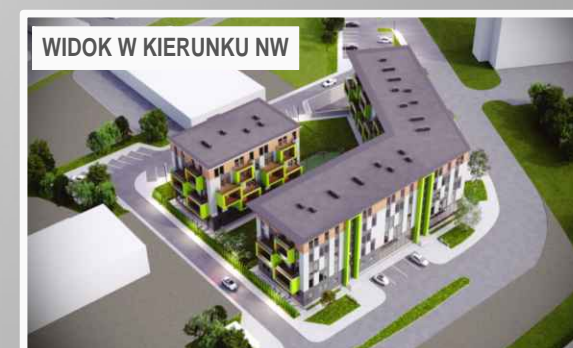
WIDOK W KIERUNKU NW