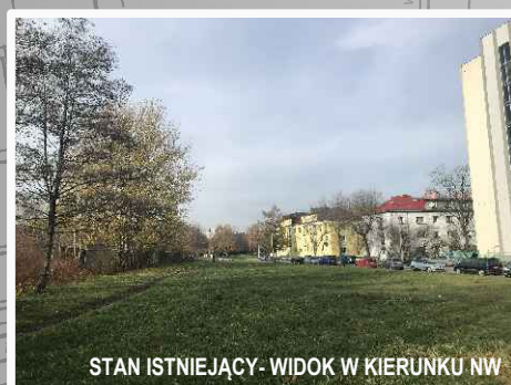
STAN ISTNIEJĄCY- WIDOK W KIERUNKU NW