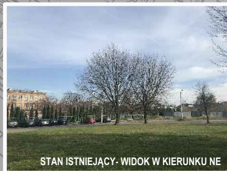
STAN ISTNIEJĄCY- WIDOK W KIERUNKU NE