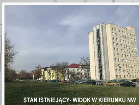
STAN ISTNIEJĄCY- WIDOK W KIERUNKU NW