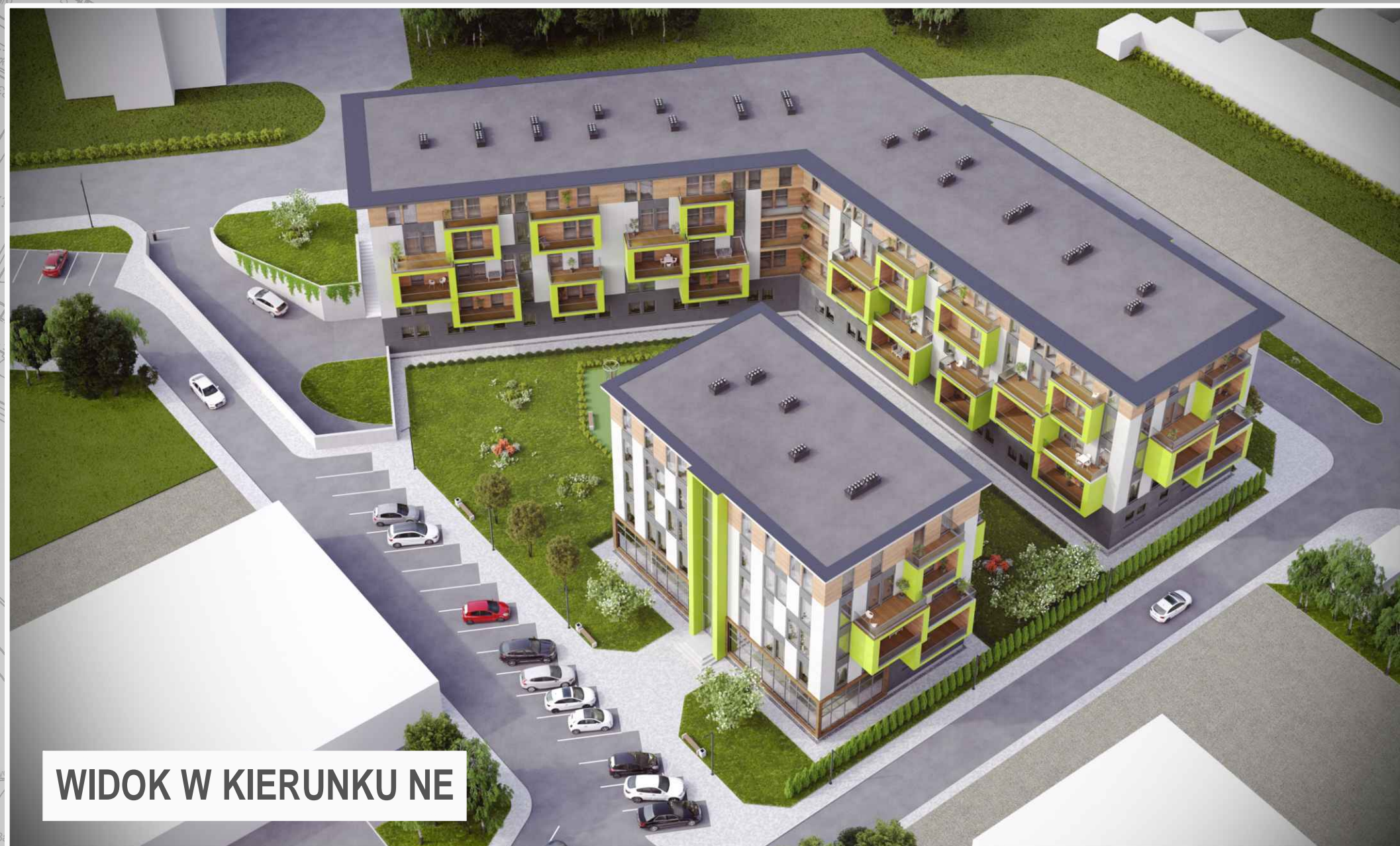
WIDOK W KIERUNKU NE