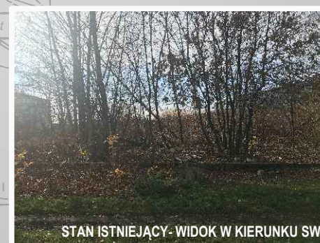
STAN ISTNIEJĄCY- WIDOK W KIERUNKU SW